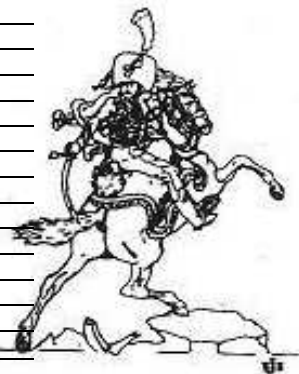
Officier de chasseur à cheval de Géricault (Mini-Collection)