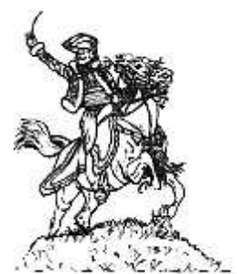
Lasalle d'après Detaille (Mini-Collection)